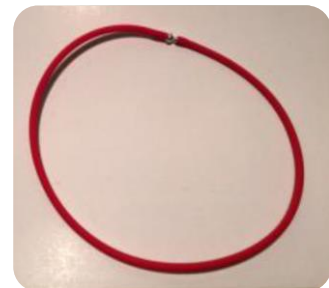
Band für kleine Hunde